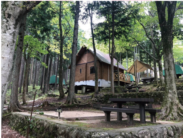
▲求菩提キャンプ場