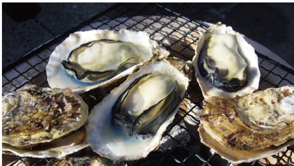
▲豊前海一粒かき焼き