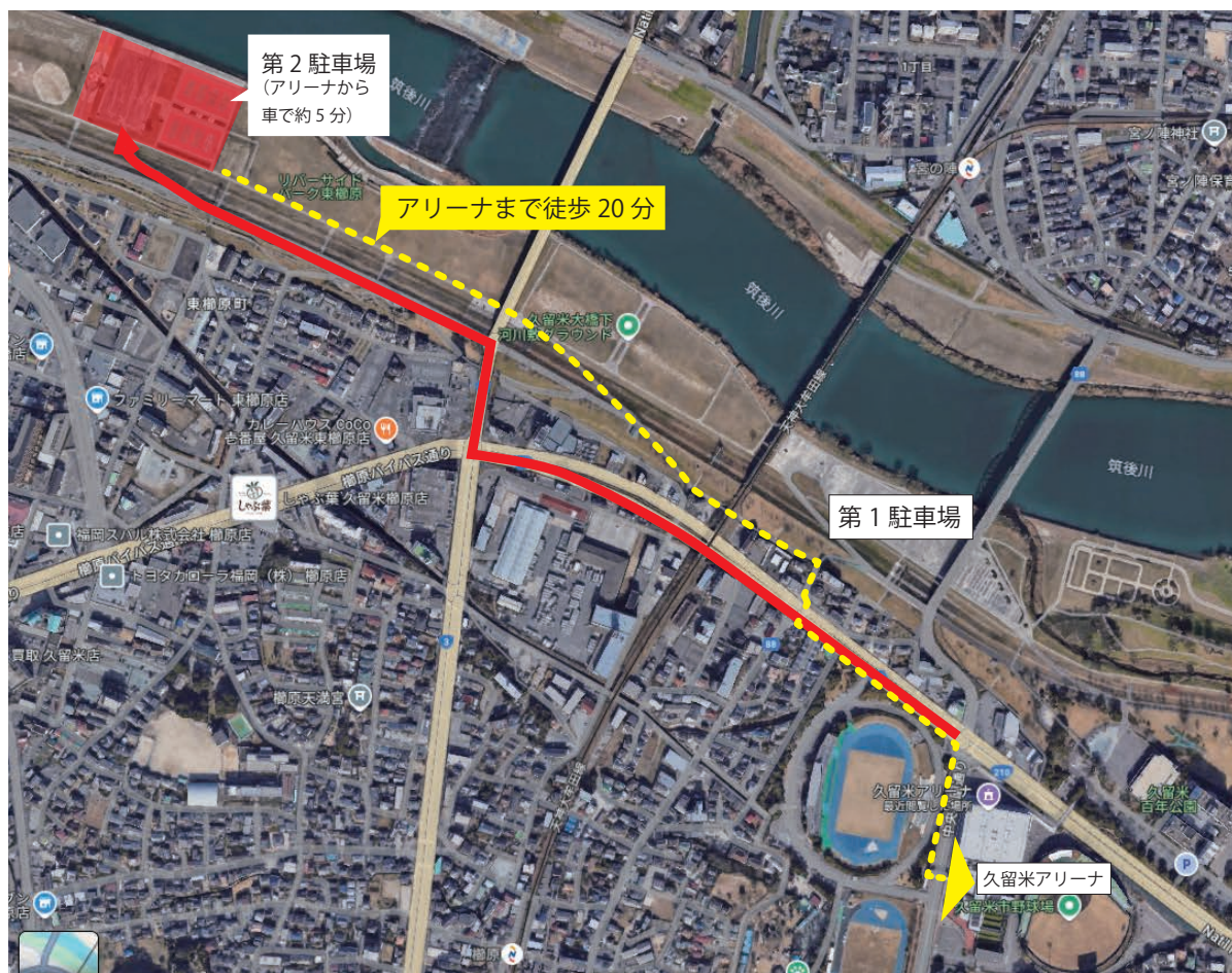
第1駐車場 (宮の陣橋側)